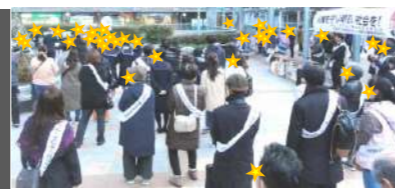
※これまでに実施した人権啓発キャンペーンの様子です。